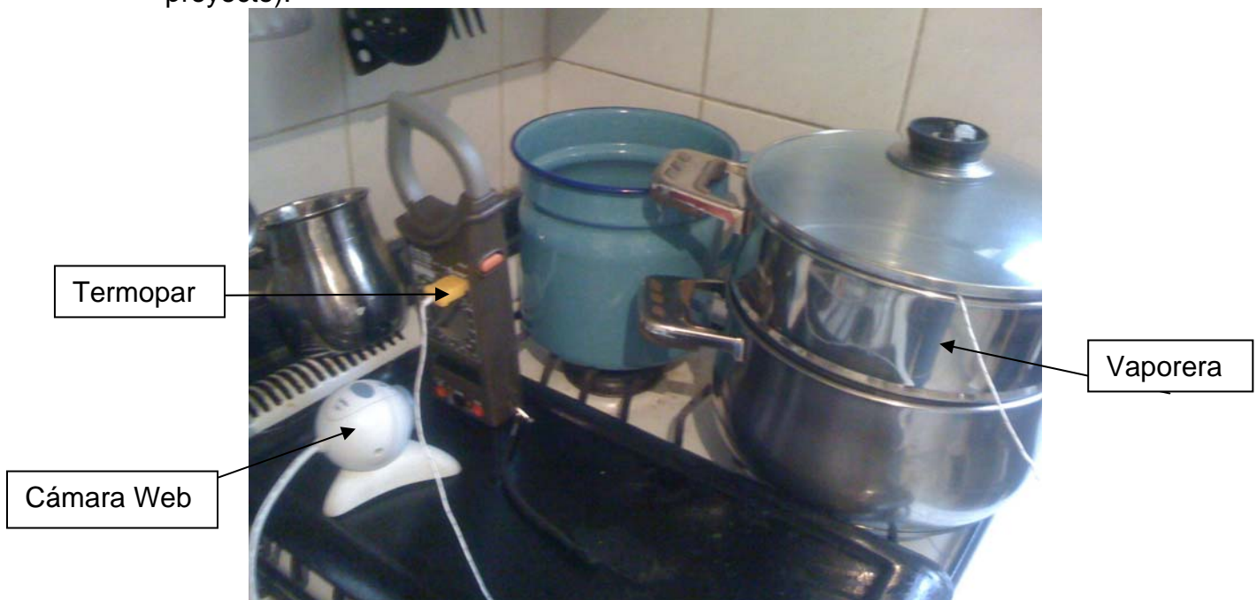
Conectado ya a la verdura, el termopar muestra la temperatura mientras que la cámara monitorea los cambios en la pantalla.

La temperatura dentro de las verduras se midió con un termopar digital que colocamos en el centro de la verdura por medio de una pequeña perforación, como se puede apreciar en la imagen 1. Mediante un sistema de cámara web y con software libre ligeramente alterado, medimos el tiempo desde que la verdura entra en contacto con el vapor hasta que el centro de la verdura alcanzara una temperatura y permaneciera ahí por lo menos 2 minutos (esto es lo que propiamente llamaremos temperatura de cocción en nuestro proyecto).