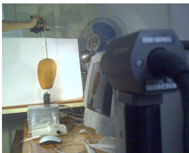
Figura 1.1: Equipo de análisis de imágenes. Una Cámara especial toma fotos de las papayas.

Metodología: Se compraron las papayas que posiblemente estaban ya contagiadas (las buscamos con pequeñas manchas de antracnosis). Se realizaron los dos experimentos con seis papayas a 4°C durante cuatro días y seis papayas a 24°C. Cada día se midió el avance de la infección usando el equipo de análisis de imágenes, que se muestra en la figura 1.1. Utilizando los datos obtenidos, calculamos el crecimiento de las manchas de antracnosis en cada papaya. Graficamos el área de infección de cada papaya contra el tiempo (medido en días).