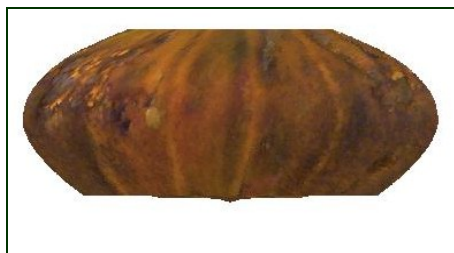
Figura 1.3: Cartografía obtenida después de haber procesado las imágenes tomadas por el equipo de análisis de imágenes.